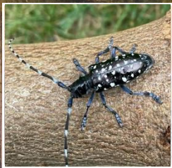
Asiatischer Laubholzbockkäfer Gefahr für den Wald