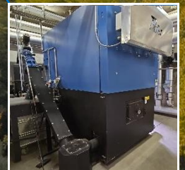
Wärmeverbund Blick in die Heiz- zentrale Schlossfeld