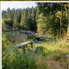
Guonwald Massnahmen gegen den Klimawandel