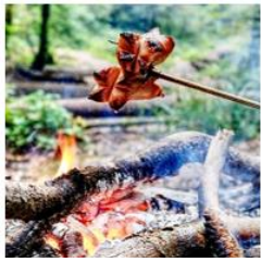
Cervelat braten Am offenen Feuer beim Hirserenhüttli