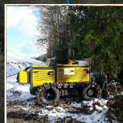
Holzrücken Ferngesteuert - probier's selber aus!