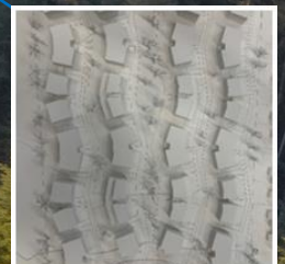
Schwyzermatt 2 Der aktuelle Stand des Bauprojekts