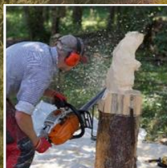
Holzskulpturen Geschickte Hände mit der Kettensäge