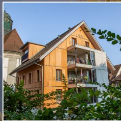
Korporationshaus Start der Tour Chilegass 15