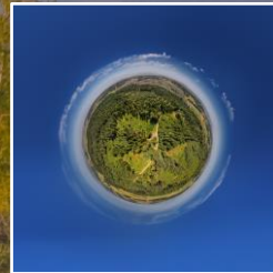
Coole Fotografie So schön ist es rund um Willisau